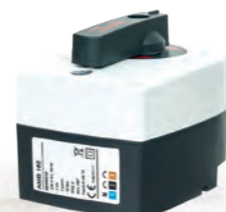
AMB Редукторные электроприводы