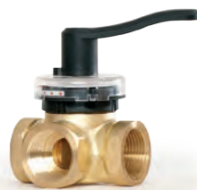
HRB 3/4 Регулирующие поворотные клапаны, латунные, резьбовые

Широкая линейка клапанов удовлетворит любые потребности покупателей