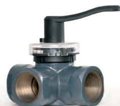
HRE 3/4 Регулирующие поворотные клапаны, чугунные, резьбовые