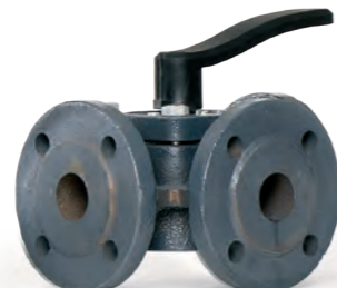
HFE 3 Регулирующие поворотные клапаны, чугунные, фланцевые